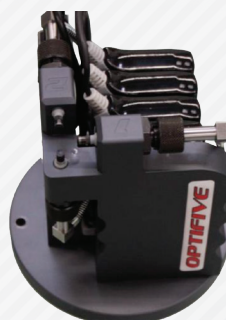
Interface tactile Bluetooth®